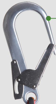
Conector 49 Connector 49